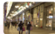
駅前商店街の買い物 贈り物まわりの産物めぐり