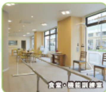
食堂・機能訓練室