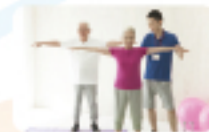
「ゴクニサイズ」:頭と体を使う認知症予防