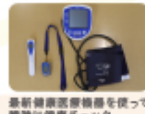
最新健康診断機器を使って瞬時に健康チェック